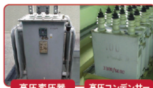
高圧変圧器 高圧コンデンサー