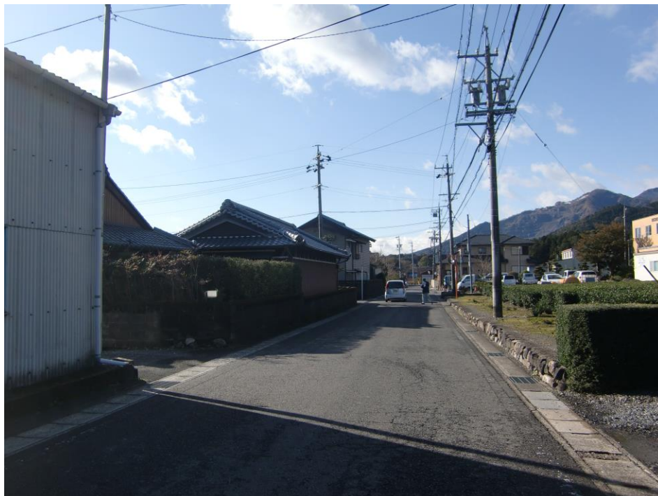
写真②：主要地方道四日市関線（バイパス）