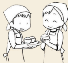
取材：NPO法人 太陽の家