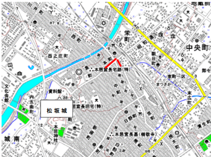
(国土地理院 「松阪」 1:25,000 より)

松坂城下町が整備されたのは、天正十六（1588）年に蒲生氏郷が松ヶ島城から四五百森（よいほのもり）に居城を移したのが始まりです。