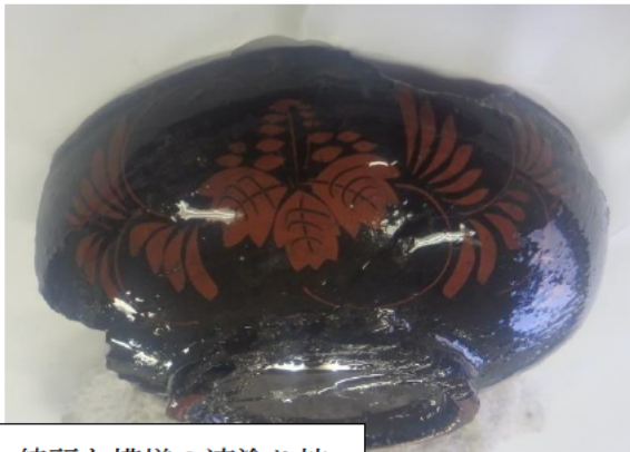
綺麗な模様 of 漆塗り碗