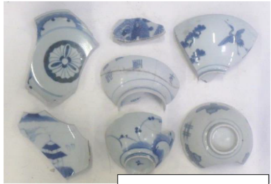
色々な模様 of 磁器碗