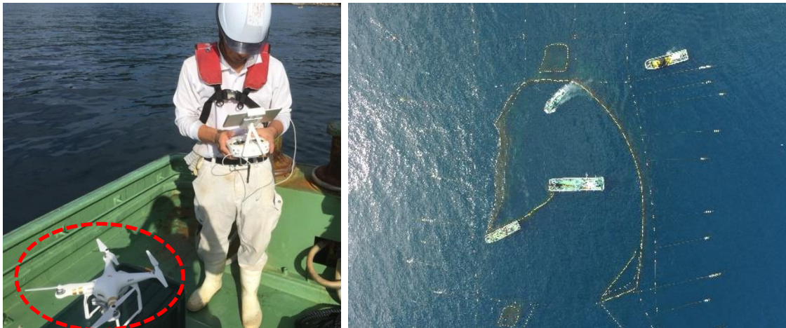
図8. ドローンの活用（左）、上空から見た大型定置網（右）