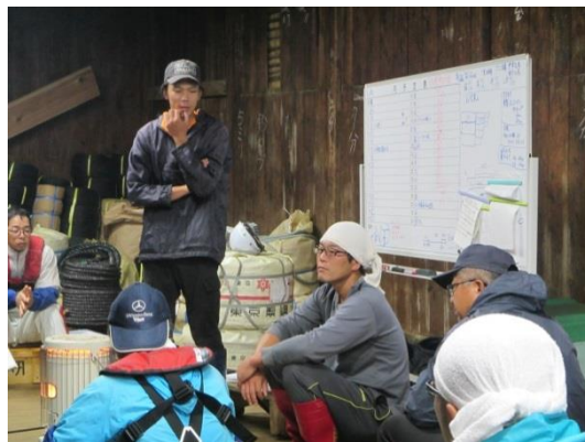
図4. 作業前ミーティングの様子

(図4)、②中堅乗組員による若手乗組員の指導、③乗組員の知識習得機会(勉強会)の提供、④中堅職員の職長教育研修会の受講支援などを行った。