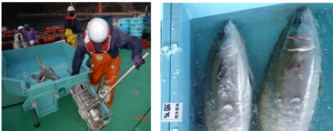
図 6. 手動式活魚〆処理機による船上活〆（左）、船上活〆されたブリ（右）

春に来遊するブリは、近隣の定置網で大量に漁獲されると値崩れが起きることが課題であった。そこで、平成 28 年漁期から試験的に活〆による付加価値向上を図り、仲買業者からの評価を聞き取った。改革型漁船（19 トン）を新造した平成 29 年漁期からは、新たに手動式活魚〆処理機を導入し、「船上活〆ブリ」として差別化して市場水揚げを行った（図 6）。また、大型の金庫網を導入することで、活魚出荷の体制も整えた。ブリ漁期を通して、船上活〆を継続して水揚げし、乗組員が落札価格の確認と仲買業者のニーズを聞き取りながら、船上活〆の適正数量の検討や、船上活〆と活魚の出荷量の調整に努めた。その結果、水揚げしたブリ全体の単価は、改善前（平成 22 年から平成 26 年の平均）の 365 円/kg から 393 円/kg となり、約 8 % 向上した。その内、水揚げの約 1 割にあたる 16 トンを船上活〆しており、平均単価は 544 円/kg と、地元スーパーや小売り業者から非常に高い評価を得た。