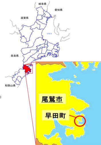
図 1. 尾鷲市早田町位置図

早田地区は湾奥の小さな集落で、漁業の町として栄えた。しかし、昭和 35 年の人口 678 人をピークに、その後は過疎化と高齢化が進み、現在は 128 人、高齢化率約 66%の、限界集落となっている。