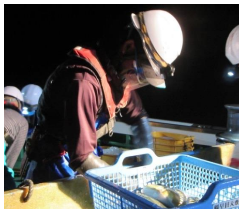
図5. ヘルメット、フェイスシールドを付けた魚選別作業

ミーティングではその日の天候や波高の状況、装具の点検を、作業時にはヘルメットの装着も徹底している。さらに、魚の選別作業時の鱗跳ねから目を守るためにフェイスシールドを導入するなど、他の定置を参考にして対策を施している(図5)。