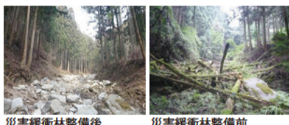
災害後森林整備後

答 県民税導入により「災害に強い森林づくり」等の取り組みが本格化しており、県民の安全・安心の確保には大変重要と考えています。近年の台風や豪雨災害を踏まえると、防災・減災対策の充実・強化が最優先課題であるため、一部見直しの上で、平成31年度以降も県民税を継続し、県民の皆さんと共に関わり合い取り組んでいきます。