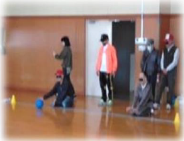
鈴の入ったボールを用いゴールを奪い合います この日はキャッチボールの体験