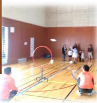
立てられたフープに ディスクを通します