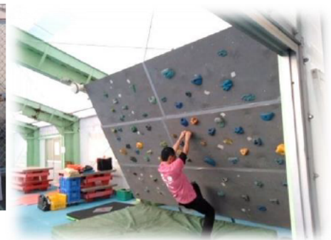
プールサイドに設営された ボルダリング体験コーナー