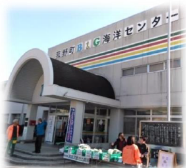
菟野町 B&G 海洋センター クラブの事務局があります