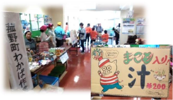
菟野町わかば作業所も出展 今話題の“まこも”入りのトン汁が絶品