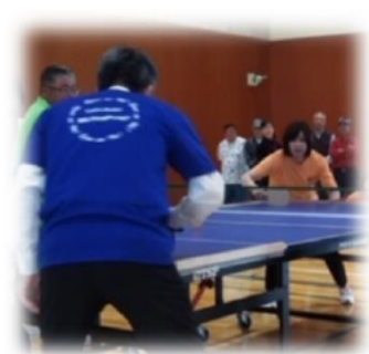
和やかな雰囲気ではじめたエキシビジョンマッチは、町長・市長の真剣なプレーで白熱した展開に。観戦者の応援にも熱が入りました。中央は試合後の記念撮影の様子。このフェスティバルの趣旨が具現化された瞬間でした。

《連絡先》 特定非営利活動法人 元気アップこものスポーツクラブ 〒510-1233 三重郡菟野町菟野 4775-1 (菟野町 B&G 海洋センター内) TEL・FAX:059-394-5018