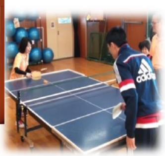
SSとは「生涯・スポーツ」の意味 障がいの有無にかかわらず楽しめます