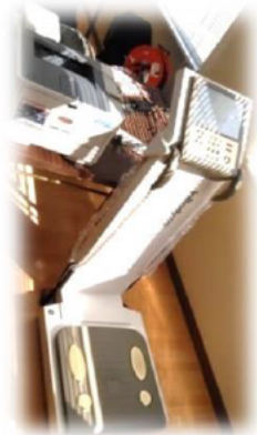
体重や筋肉量、脂肪量など測定する体成分分析装置 結果が印刷されすぐに確認できます