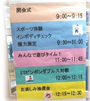
フェスティバルのスケジュール