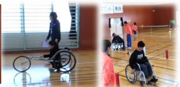
競技用と通常の車イスと両方の体験ができます