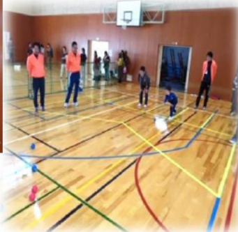
最終的に白的球（ジャック） に一番近づけたチームが勝利