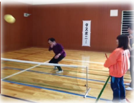
スポンジボールを素手で打ち合う テニスに似たニュースポーツ