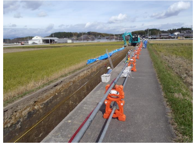
農道沿いに細長い調査区が延びています。