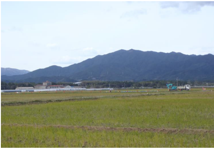
調査区の遠景です。