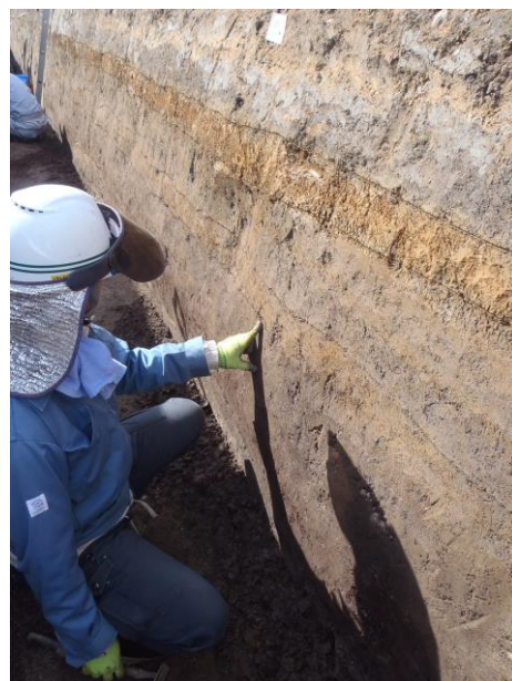
調査区の壁を削り分層中。