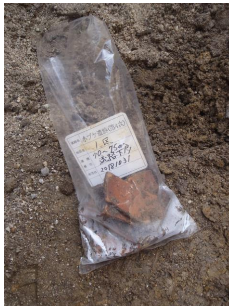
流路の下層から遺物が。