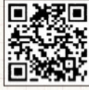
▲議会ホームページ

〒514-8570 津市広明町13 ☎ 059(224)2877 ☎ 059(229)1931 ✉ gikaik@pref.mie.jp 🌐 http://www.pref.mie.lg.jp/KENGIKAI/ 📱 http://www.gijiroku.jp/mie/ (スマホ版)