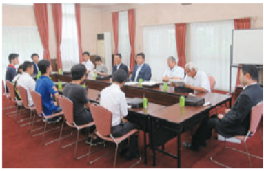
三重大学(津市)での調査