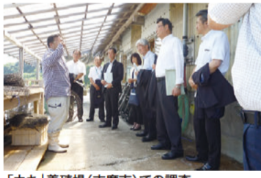
「カキ」養殖場(志摩市)での調査

また、環境負荷低減のための省エネや廃棄物削減の取り組みを行う企業において調査したほか、「カキ」を養殖する企業および志摩市社会福祉協議会では、水産分野と福祉分野の連携推進(水福連携)の取り組みを調査しました。