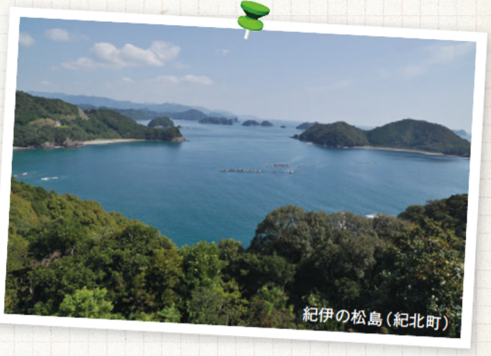
紀伊の松島(紀北町)