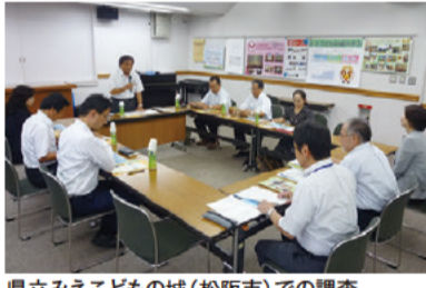
県立みえこどもの城(松阪市)での調査

また、三重大学医学系研究科では、認知症の予防、維持・改善について、産官学連携の研究結果や今後の認知症対策について調査・意見交換を行ったほか、県立こころの医療センターでは、精神科医療の現状やデイケア病棟などの見学を行いました。