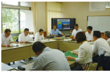
御浜町立尾呂志学園小・中学校での調査

また、四日市北警察署の新庁舎では、その新機能を調査し、機動隊庁舎では警備実施の中核となる機動隊の施設や訓練の状況等について調査しました。