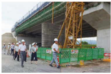
東海環状自動車道工事現場(いなべ市)での調査

また、台風第21号により被災した公共土木施設の復旧状況および水防災協議会の取り組みについて調査しました。