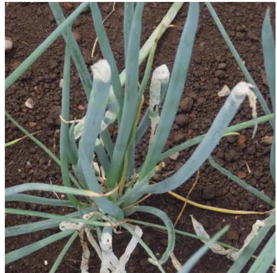
（図2）ネギでの被害状況