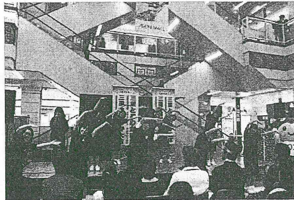
ダンスを披露する鈴鹿高校ストリートダンス部