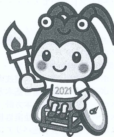
マスコットキャラクター 「とこまる」