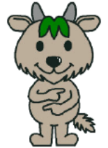
「できるカモン」 三重県聴覚障害者協会 マスコットキャラクター