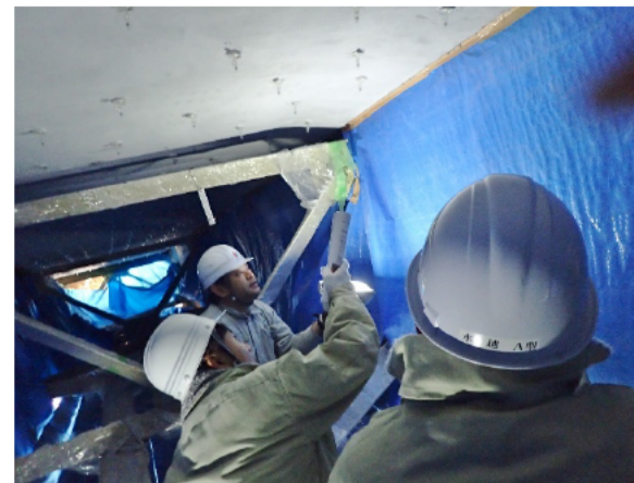
床版補修の施工状況の確認