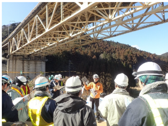
床版劣化についての講習