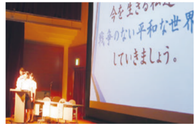
昨年開催した平和のつどいの様子 「県内の大学生による活動発表」

戦後70年以上が経過し、県内でも戦後生まれの人の割合が8割を超え、戦争の悲惨な実態と教訓が風化することが懸念されます。県では、未来を担う若い世代をはじめとする多くの県民の皆さんに、戦争の悲惨さと平和の尊さを伝える機会づくりに取り組んでいます。