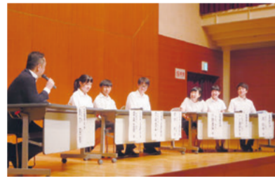
「三重県と広島県の学生による トークセッション」