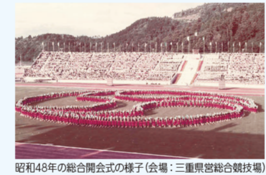
昭和48年の総合開会式の様子(会場：三重県営総合競技場)

高校生アスリートの夢の舞台の幕開けを、県内の高校生が式典と歓迎演技で彩ります。※観覧の募集は終了いたしました。