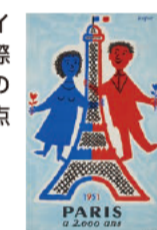
(1951年、丸屋生2000年記念) 1951年、ポスター・アート・グラフィック、パリ市フォルネー図書館蔵 © Annie Charpentier 2018

問い合わせ先 三重県立美術館 ☎059-227-2100 FAX 059-223-0570