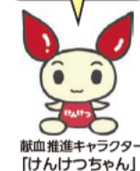
献血推進キャラクター「けんけつちゃん」