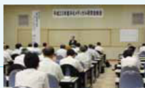
みえメディカル研究会総会の様子