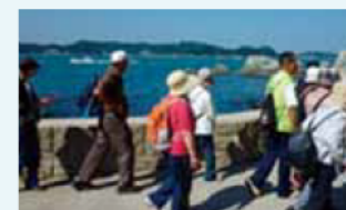
ウェルネスの旅の様子

三重県内に豊富に存在する天然資源を活用し、新製品の開発や新産業を創出し、地域の活性化を促進するために、平成15年度から平成19年度までの5年間にわたり全県域で天然資源活用調査を実施しました。当プロジェクト開始後からこれまでに、県内各地で天然資源を活用した製品やサービスの開発が進んでいます。