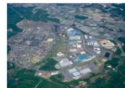
薬事工業の集積地 ゆめぼり伊賀クリエイトランド

藤森工業株式会社 三重事業所 増設 / 太陽化学株式会社 塩浜工場内に乳化剤工場新設 / ニプロファーマ株式会社 伊勢工場 増設 / 株式会社メディテックジャパン三重工場増設