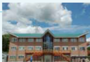
三重大学伊賀研究拠点