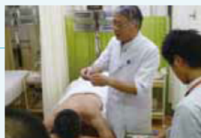
統合医療・鍼灸外来の様子