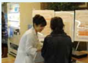
治験啓発キャンペーンの様子