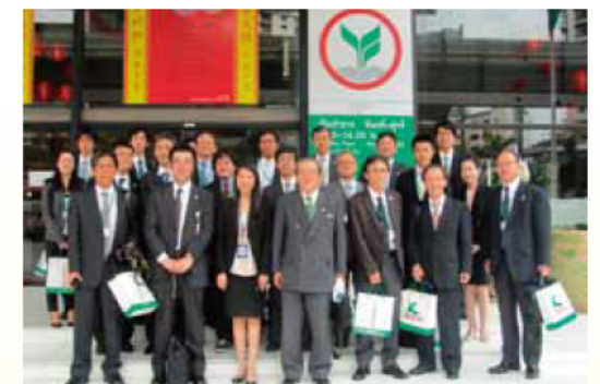
カシコン銀行訪問