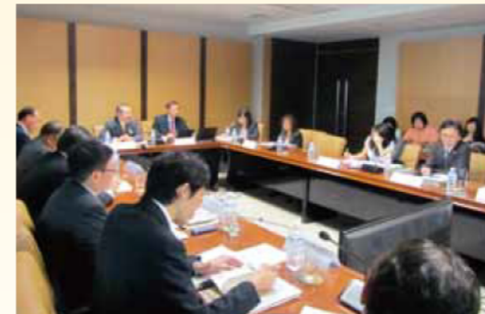
FDAとのミーティング

平成24年1月22日(日)から28日(土)まで、三重県薬事工業会主催によりタイ薬事産業ミッションが実施され、産学官のメンバー20名により、政府機関(タイ国投資委員会、タイ国食品薬品庁)、金融機関及び現地製薬企業を訪問し、今後の県内の薬事関係企業のタイへの投資に向けて、タイ国関係者との連携・支援体制を構築しました。