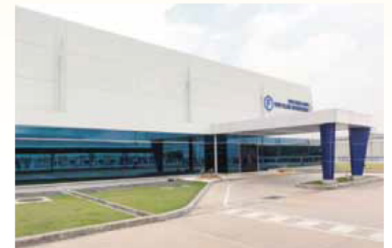
TOYO FILLING INTERNATIONAL タイ工場(東洋エアゾール)

タイ経済の状況、洪水の経緯及び今後の展望について説明を受けるとともに、タイの投資環境や商習慣、ビジネスマナー等タイに進出する際の留意点について情報を収集しました。