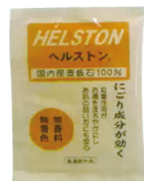
ヘルストン(医薬部外品)

平成12年に設立し、現在、麦飯石など天然素材の研究及び応用技術の開発と製造販売を行っています。麦飯石は花崗斑岩(石英斑岩)に属する鉱石で、一定数以上の微細な孔がある鉱石で、この孔が臭いや雑菌、重金属を吸着し、ミネラルを溶出するはたらきを持ちます。当社が特殊加工したヘルストンは医薬部外品として国の製造承認を受けている浴用剤です。疲労回復・肩こり・腰痛・あせも・荒れ性・神経痛・リュウマチ・ひび・しもやけに効果があります。