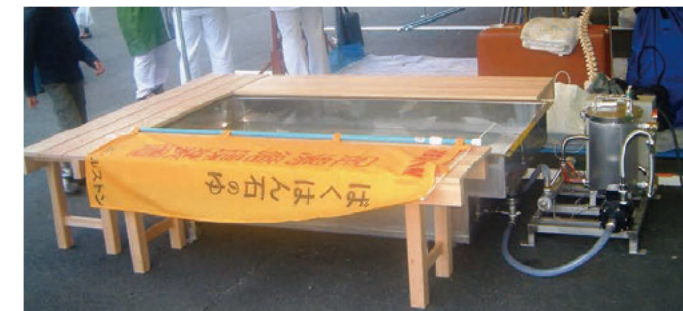
循環式足湯システム(ゆとりF)

現在、化粧品などの原料として地域資源を活用しようとする研究開発に取り組んでいます。これらの取り組みが、三重県の活性化に貢献できればと考えています。