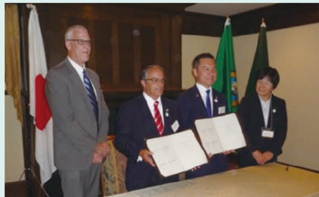
県とワシントン州政府とのMOU締結の様子

ワシントン州では、州政府と県との間で産業連携としては日本初となる覚書(MOU: Memorandum of Understanding)を締結したほか、三重大学とワシントン大学※1の医学部間での人材の交流や共同研究を進めるための覚書(MOU)の締結、WBBA(ワシントン州バイオテクノロジー&バイオメディカル協会※2)に対して統合型医療情報データベースや治験ネットワーク活用など「みえライフイノベーション総合特区」の取り組みを生かした交流・連携に向けた知事によるトップセールスが実施されました。