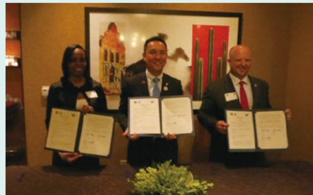
WBBAトップセールスの様子

テキサス州サンアントニオ市では、県とサンアントニオ市との間で、互恵的かつ戦略的な協力関係を構築するための基本合意書(LOI: Letter of Intent)を締結した他、サウスウエスト研究所※3やテキサス大学サンアントニオ校※4へのトップセールスが実施されました。