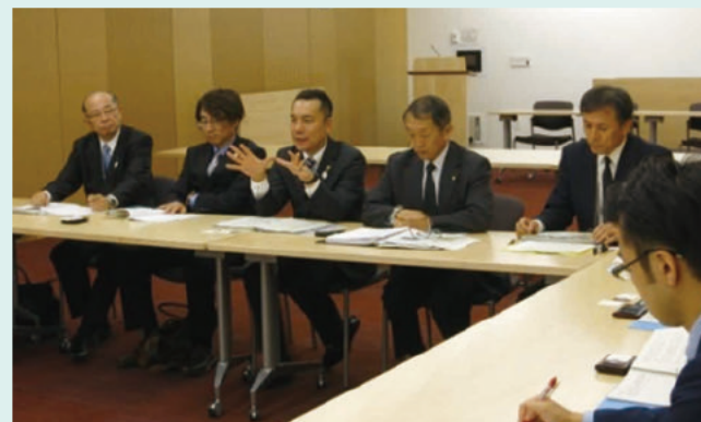
県とテキサス州サンアントニオ市とのLOI締結の様子