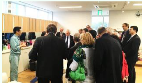
ミルボンにて開発工程の説明を受けるミッション団