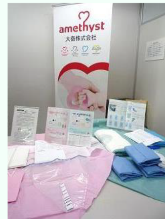
経膈分娩用キット/帝王切開用キット