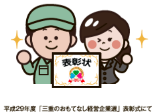
平成29年度「三重のおもてなし経営企業選」表彰式にて