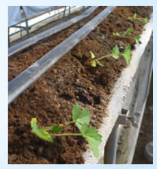
セル苗の本圃直接定植