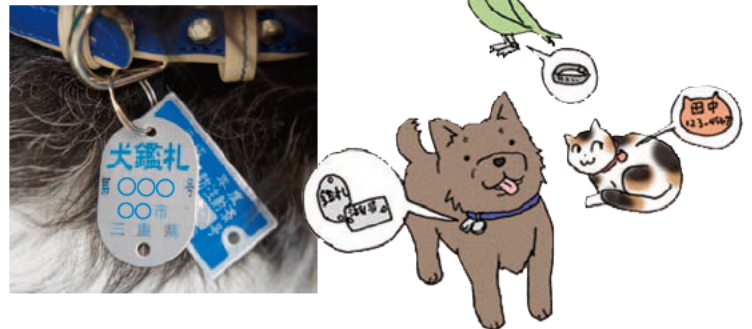
犬の鑑札と狂犬病予防注射済票

マイクロチップに記録された番号を専用のリーダー（読取機）で読み取ることで飼い主がわかります。