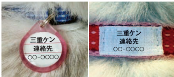
迷子札のつけ方の例

災害時にはペットと離ればなれになるかもしれません。すぐに飼い主がわかるように首輪に迷子札をつけておきましょう。犬には鑑札と狂犬病予防注射済票をつけておいてください。また、首輪が外れても確実な身元証明になるマイクロチップを入れて二重の対策をとりましょう。