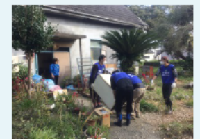
ボランティア活動 (伊勢市)