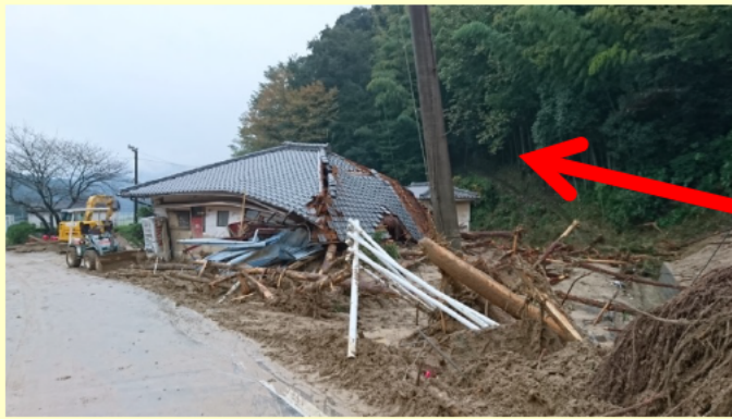
多気町長谷地区で発生した土石流