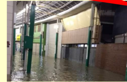
伊勢市新道商店街 浸水被害