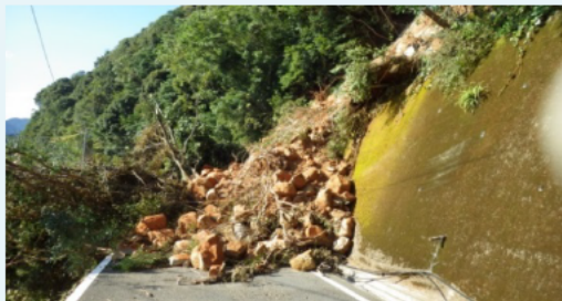
熊野市道 (遊木地区)