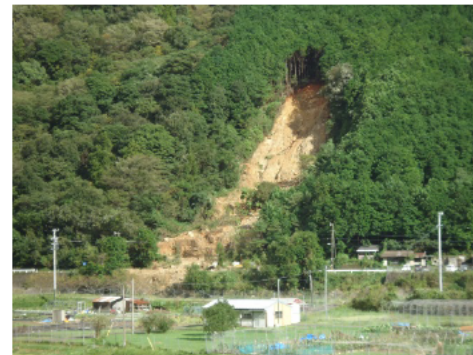
南浦海山線 (紀北町)