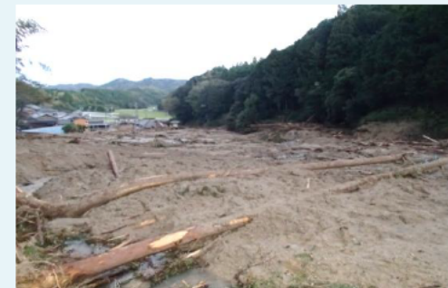
農地災害 土砂で埋没した農地 (多気町)