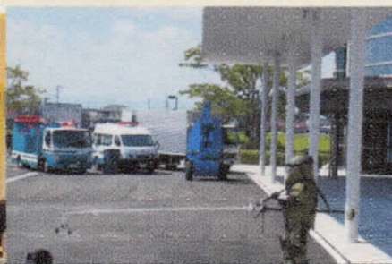
テロ対策合同訓練