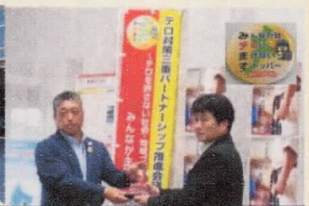
みテますキープ制度