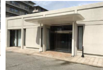
展示会場エントランス