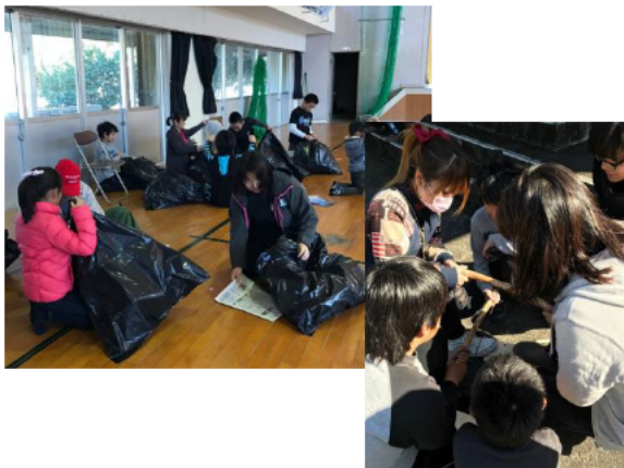
防災キャンプ、ブッシュクラフト体験