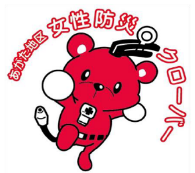
クローバーのキャラクター キュマちゃん