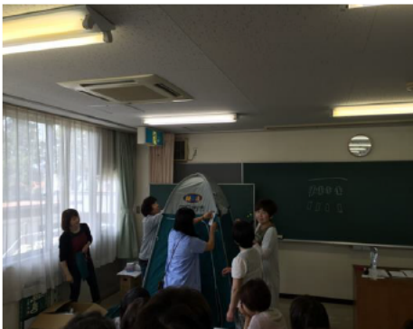
トイレについて考えよう

女性の立場で災害時に発生する問題を考え、災害に備えるための意識向上を目指す取組は、男性中心となりがちな防災活動においてたいへん重要であり、他地域への広がりも期待されるところです。