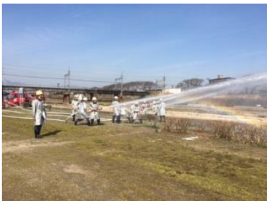
橋北消防分団と橋北市民防災隊の 合同放水訓練

各組織が相互に結びつき、地区全体の総合的な防災対策を進める取組は、他の地域においても大いに参考となるものです。