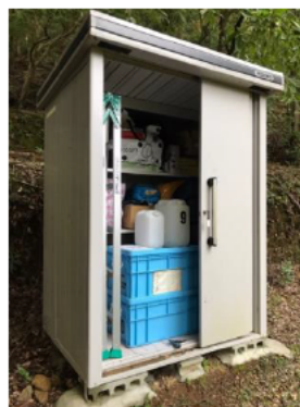
非常持ち出し袋の備蓄