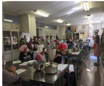
乾物を使って調理しよう 女性防災教室