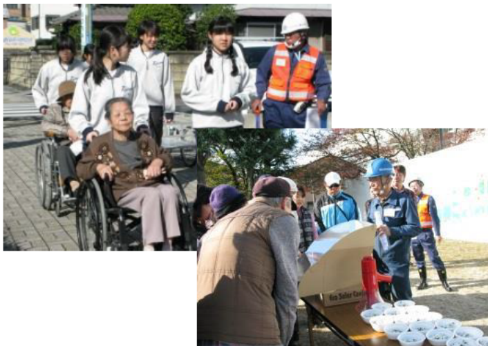
小中学校地区総ぐるみ防災訓練