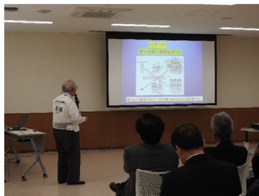
災害と医療の講演

平成29年度 消防・防災フェスタいせ 災害時の無線通信 体験できます！ 伊勢市アマチュア無線 災害ネットワーク