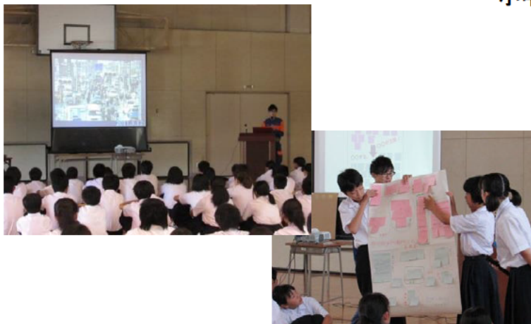
中学校での防災講演会とワークショップ