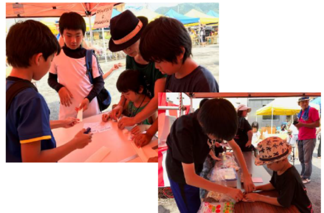
防災スタンプラリー