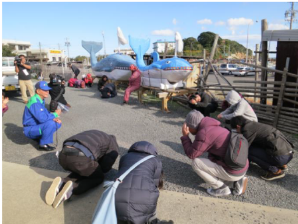
観光客・海女さんも参加の津波避難訓練

これらの取組は、他の観光地や津波の浸水が想定される地域においても大いに参考となるものです。