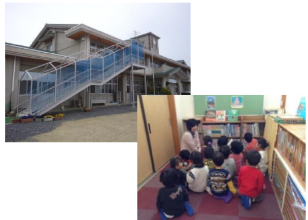
地域の声で保育所を高台へ移転