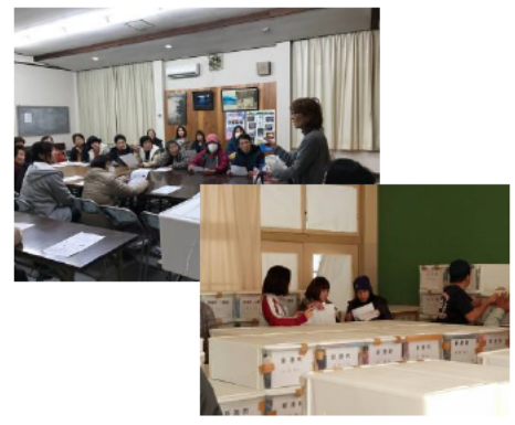
備蓄品の検討・チェック