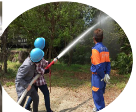
初期消火の方法を知ろう