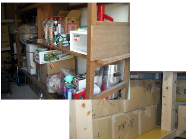
二次避難所に各世帯の備蓄