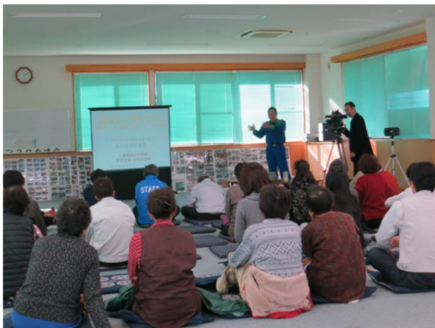
訓練の総評・検討会