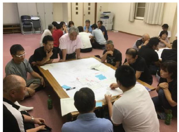
木谷独自の避難所運営の検討