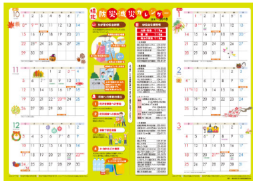
防災・減災カレンダー