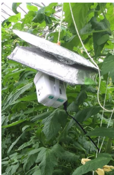
図 1 施設内に設置したセンサー

施設内の複数箇所にセンサーを設置し、施設内の気温、湿度、CO 2 濃度の分布を可視化したうえで循環扇の使用によるムラの解消効果を科学的に検証しました 結果の概要 ○複数箇所で気温などの測定、可視化をすることで、栽培施設固有のムラを明確に把握できます (図 1, 2) ○循環扇を稼働させることで、夜間の気温のムラが小さくなることが期待できます (図 3)