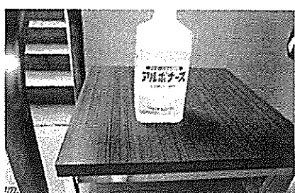
〈開閉会式会場入り口〉