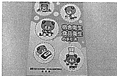
〈宿舎衛生・食品衛生の手引き〉