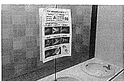
〈手洗い方法の掲示〉