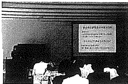
〈衛生講習会の様子〉