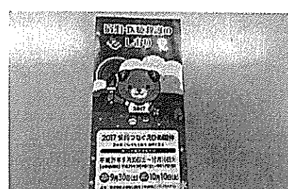
〈宿泊・医療救護のしおり〉