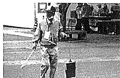
〈ごみ拾い（競技会場）〉