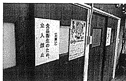
〈民泊の共同調理場〉