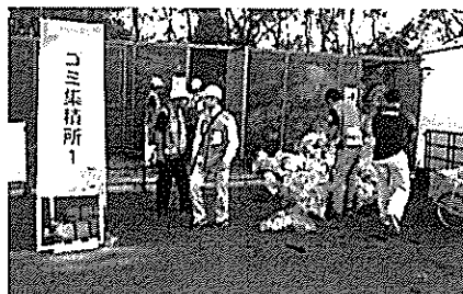
〈ゴミ集積所（開会式会場）〉