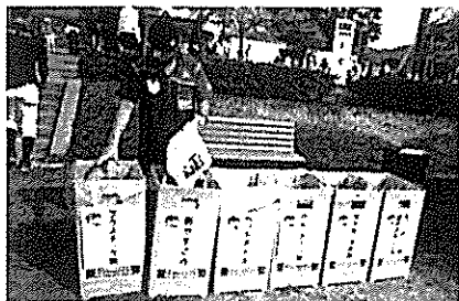
〈分別回収（競技会場）〉