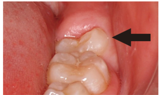
萌出中の第二大臼歯