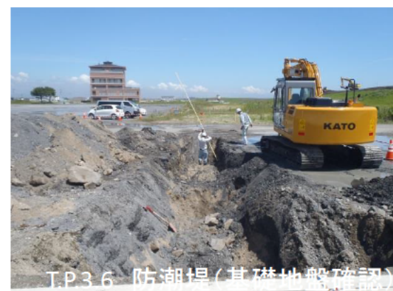
T.P.3.6 防潮堤(基礎地盤確認)