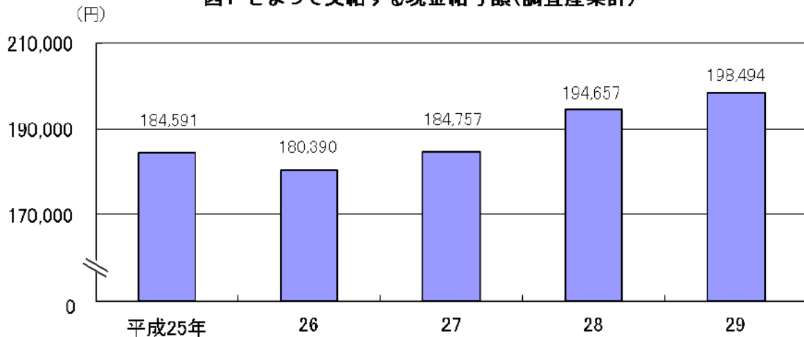
図1 きまって支給する現金給与額(調査産業計)