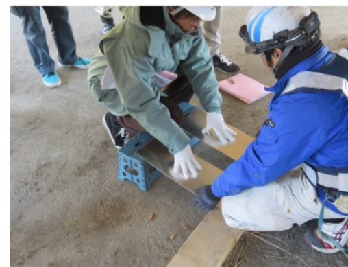
アラミド繊維シートの耐荷力体験