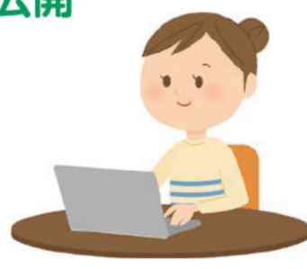
領収書等をパソコンで見ているイメージ

政務活動費の透明性をより一層高めるため、県議会ホームページで従来から公開している収支報告状況に加え、平成28年度分から領収書等もホームページで公開しています。