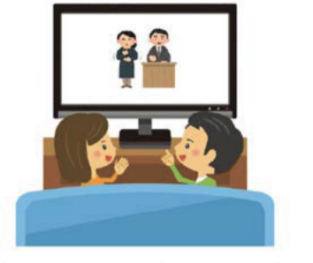
手話通訳を導入した議会中継のイメージ

平成28年6月に議員提出条例である「三重県手話言語条例」が成立し、手話による情報発信等に積極的に取り組む必要があること、また、県民を対象としたアンケート調査で、議会中継への手話通訳導入に肯定的な回答が多かったことなどを踏まえ、来年度から代表質問及び予算決算常任委員会総括質疑の中継に手話通訳を導入する方針を決定しました。