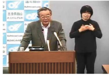
手話通訳を導入した議長定例記者会見の様子

平成28年6月に議員提出条例である「三重県手話言語条例」が成立したことを踏まえ、県議会としても、ろう者が県議会情報を円滑に取得できるような取り組みを進めています。その一環として、2月から都道府県議会としては初めて議長定例記者会見に手話通訳を導入しました。