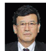
副議長 水谷 隆

県民の皆さまには、日頃から県議会の運営につきましてご支援とご協力を賜り、厚く御礼申し上げます。