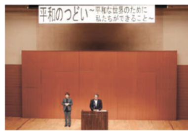
「平和のつどい」で平和の取組を紹介している様子

今年、県議会が「非核平和県宣言」を決議してから20年目の節目の年にあたります。このことを踏まえ、三重から平和を発信するとともに、県内の若い世代が被爆地の若者との交流などを通じて戦争の悲惨性に触れ、平和への想いをより一層深める機会とするため三重県主催で開催された「平和のつどい」に協力し、県議会が行っている平和への取り組みなどを紹介しました。