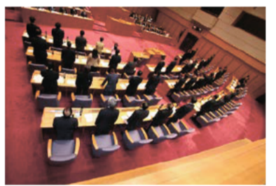
本会議での採決の様子

県議会では、北朝鮮の地下核実験実施の発表及び弾道ミサイルが北海道の上空を通過したことに対し、「北朝鮮の地下核実験及び弾道ミサイルの発射に抗議する決議」を全会一致で可決しました。この決議では、北朝鮮に対し、厳重に抗議し、断固として非難するとともに、国連安全保障理事会の決議を遵守し、全ての核兵器及び既存の核計画の放棄を求める六者会合の共同声明の完全実施及び弾道ミサイルの発射等の挑発行動の自制を改めて強く求めました。