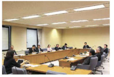
参考人招致の様子

委員会では、県内労働者の働き方の実態や課題を把握し、働き方改革の実現に向けた具体的な方策や行政の果たす役割などについて調査を行っていくこととし、県内調査や県外調査、参考人招致を実施するなど活動を続けています。