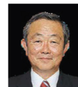
議長 舟橋 裕幸