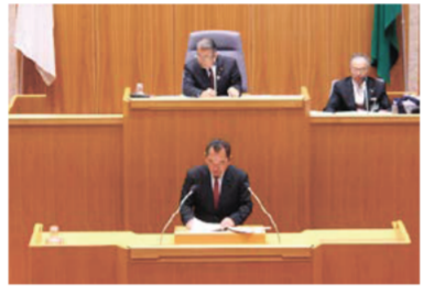
委員長報告の様子

3月21日に行われた最終の委員長報告では、県当局に対して、中長期的な視点も含めた子どもの貧困対策について提案・要望を行いました。また、3月24日には、子どもたちが社会から孤立することなく安心して過ごせる居場所モデル事業の構築、児童養護施設退所後等の子どもたちの自立支援、市町等関係機関との一層の連携、支援が必要な家庭への積極的な情報提供等について知事に提言を行いました。