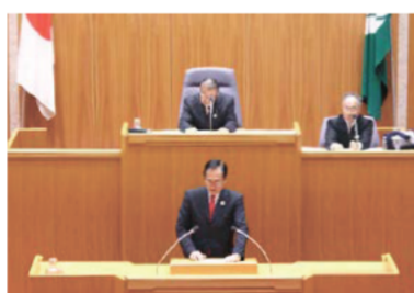
本会議で議案説明の様子

議会経費縮減のため、「三重県政務活動費の交付に関する条例」の一部を改正し、平成29年4月1日から平成30年3月31日までの間に交付される政務活動費を、条例本則に規定する額から20%特例的に減額しています。