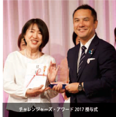
チャレンジャーズ・アワード 2017 授与式