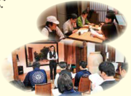
職場へのフィードバックの様子