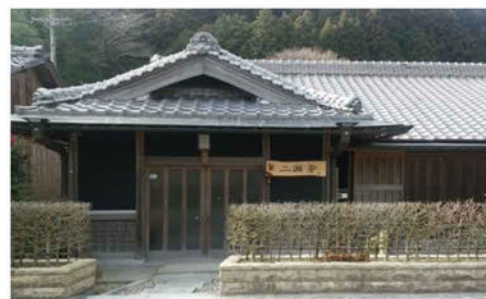
古民家を改修した民泊施設「二瀬屋」