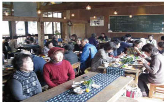
多目的レストハウス「ハナレ」での交流風景