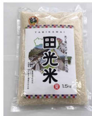
地域ブランド米「田光米」