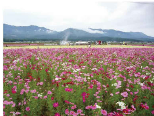
コスモス畑で収穫祭を開催