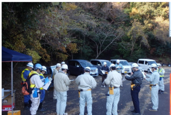
点検について説明