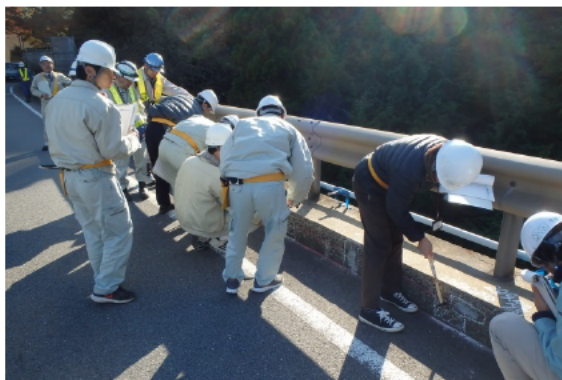
テストハンマーによる打音確認