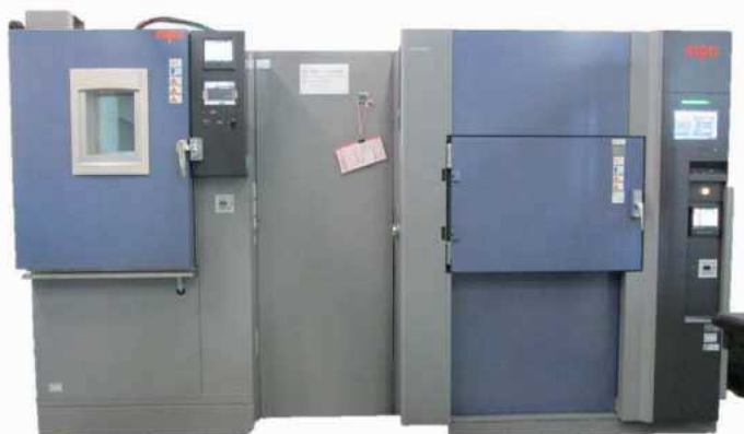
メーカー名：エスペック(株) 型式：TSAHRG-203ES300306H

半導体の動作温度の上昇や電子部品の実装方法・鉛フリー化などに対応した電子機器の信頼性評価試験方法に使用。