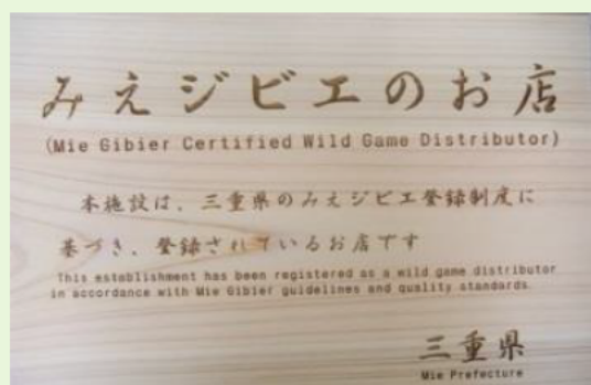
みえジビエ表示看板