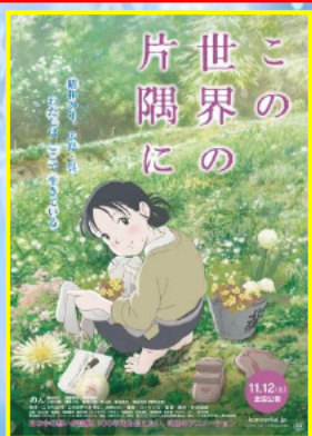
この世界の片隅に 製作委員会