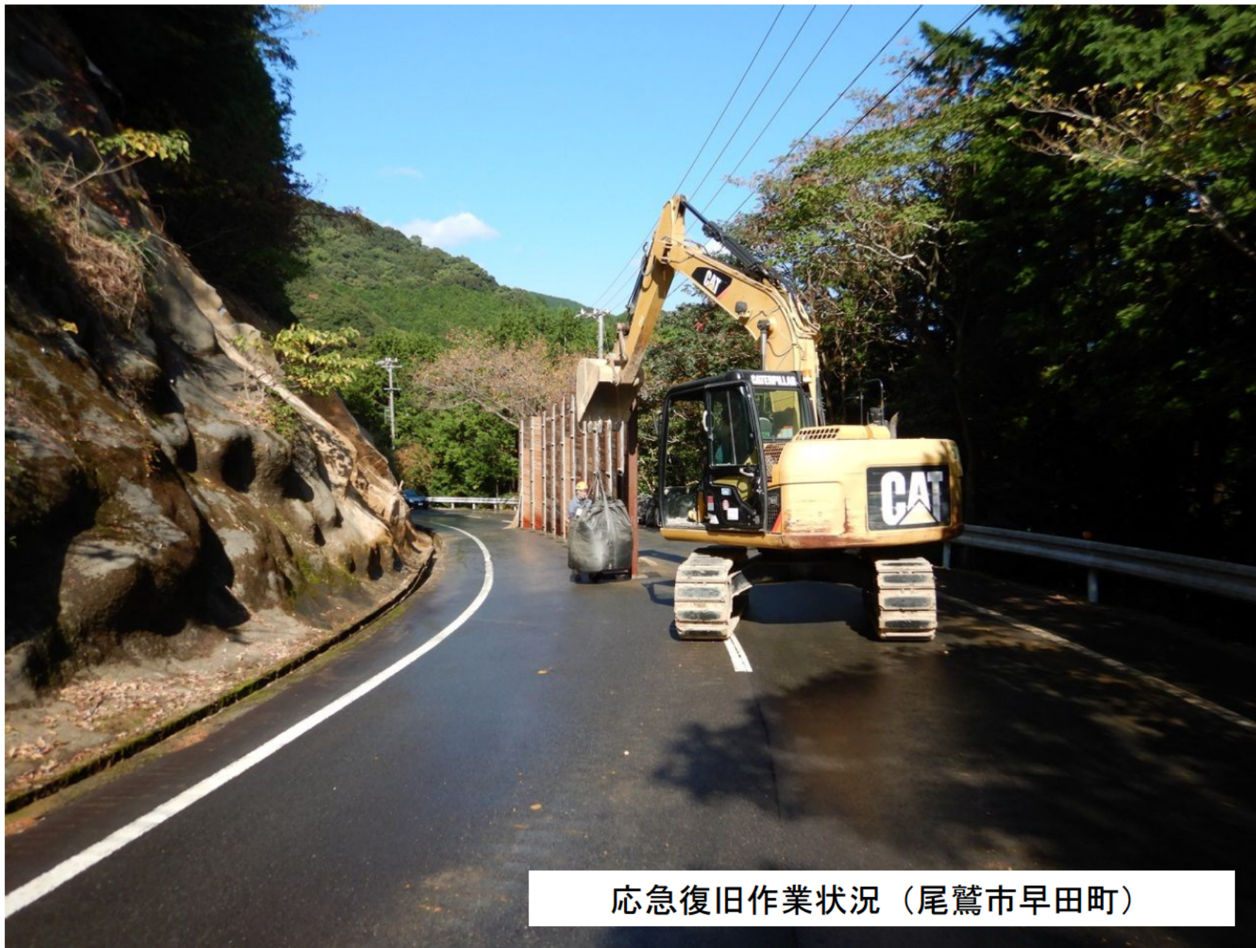
応急復旧作業状況（尾鷲市早田町）