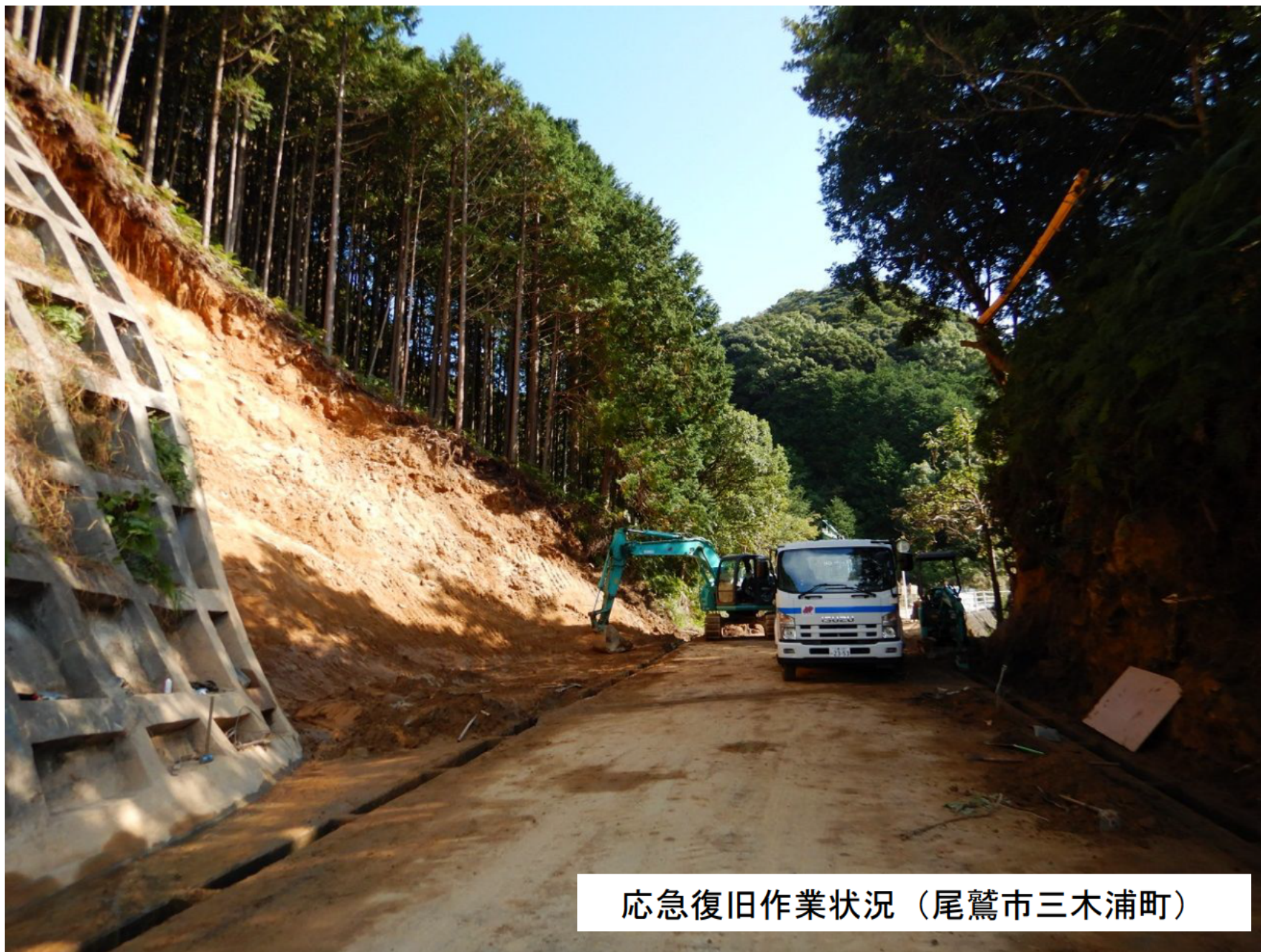
応急復旧作業状況（尾鷲市三木浦町）