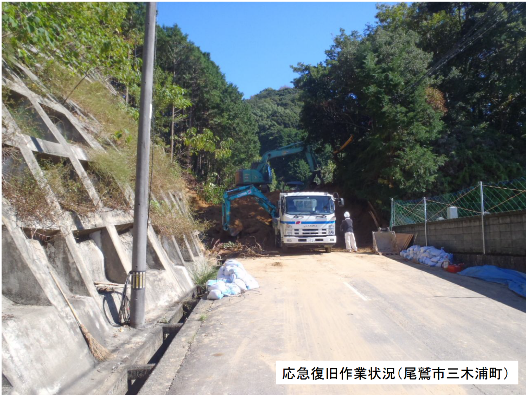
応急復旧作業状況(尾鷲市三木浦町)