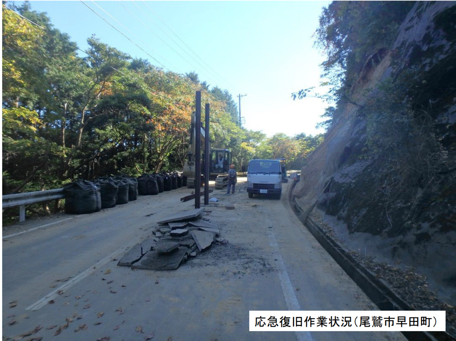
応急復旧作業状況(尾鷲市早田町)