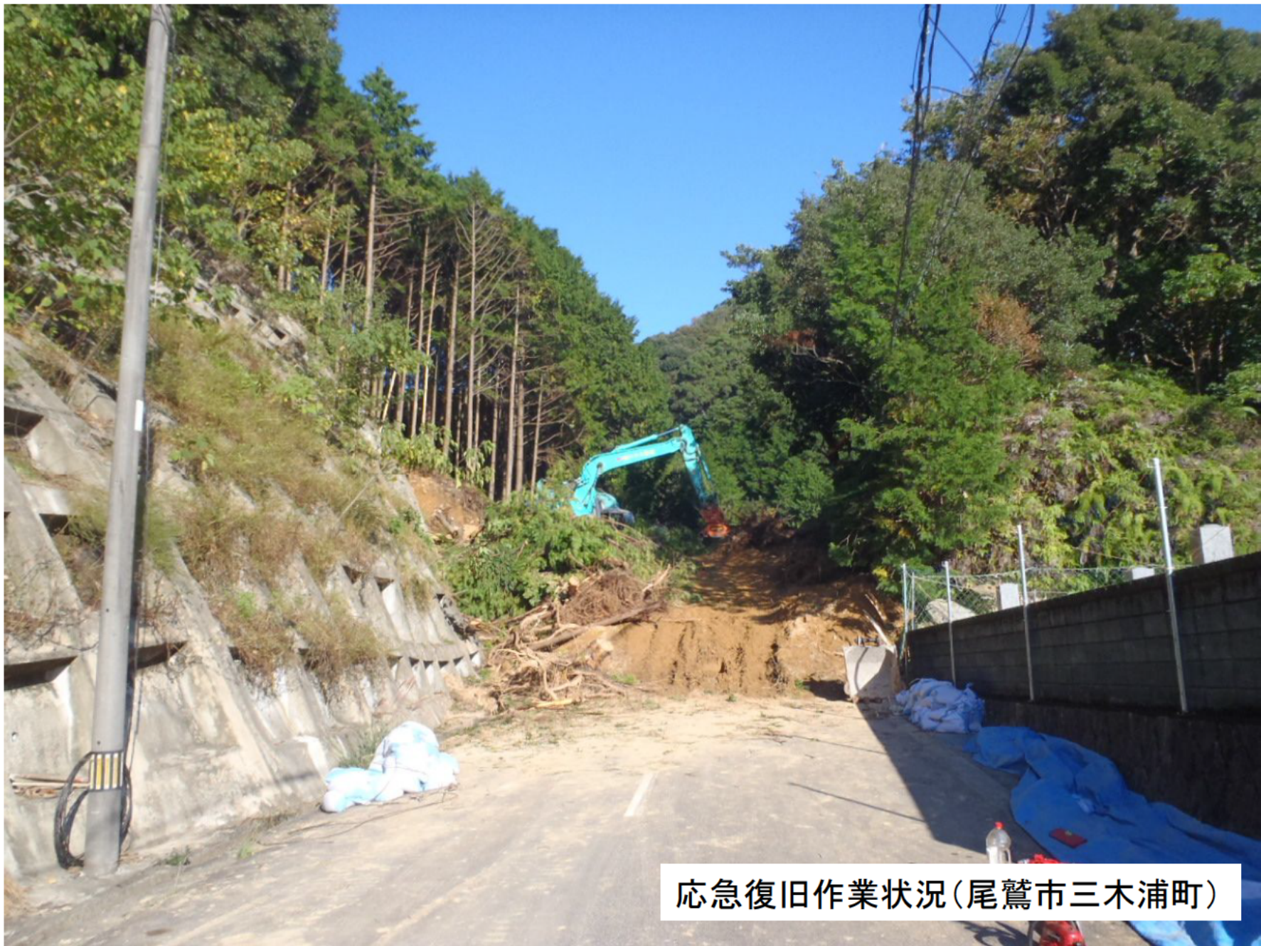
応急復旧作業状況(尾鷲市三木浦町)