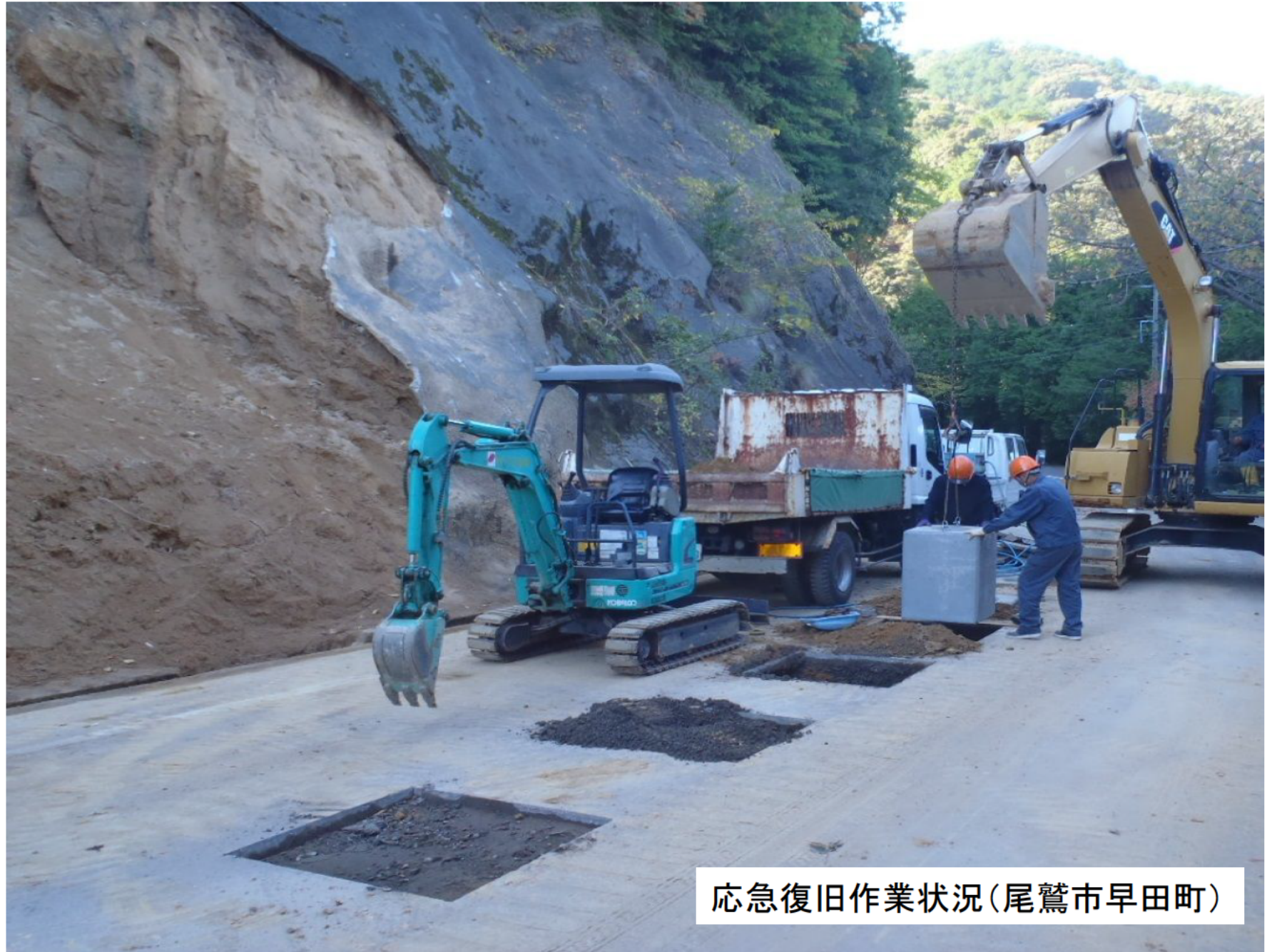
応急復旧作業状況(尾鷲市早田町)