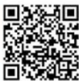
ユーチューブへのQRコード