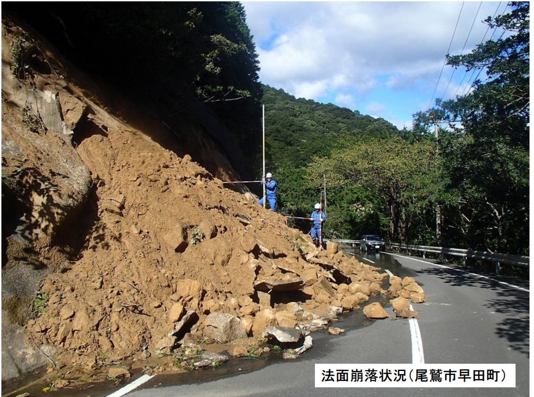
法面崩落状況(尾鷲市早田町)