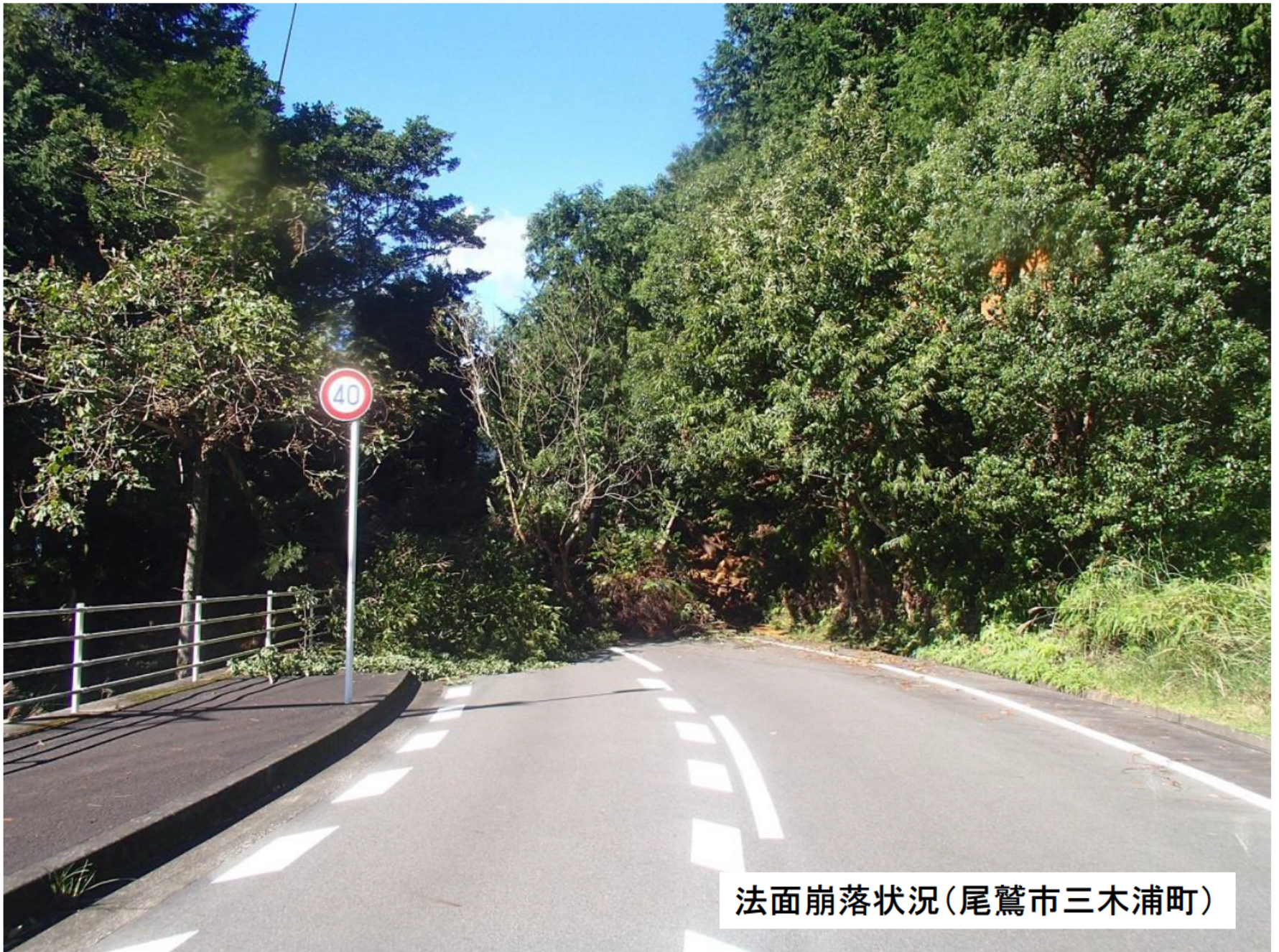
法面崩落状況(尾鷲市三木浦町)