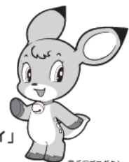
鈴鹿市マスコットキャラクター「ベルディ」