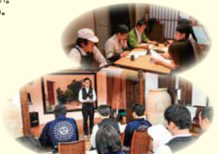
職場へのフィードバックの様子