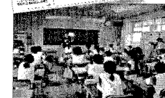
小学生からのメッセージ カードによる注意喚起