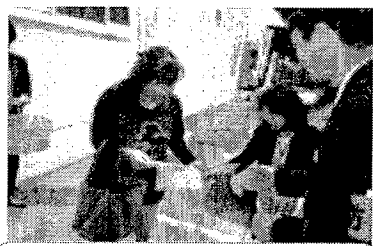
撲滅員と連携した啓発活動 (特殊詐欺撲滅の日)