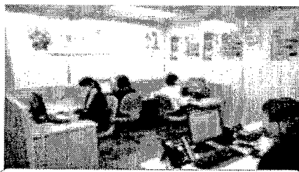
三重県警察 三重の見守り コールセンターによる注意喚起