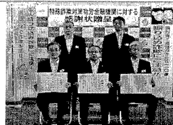
ATM対策導入金融機関 への感謝状贈呈