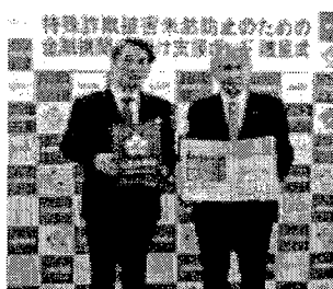
声掛け支援ボードの贈呈