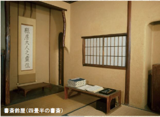
書斎鈴屋(四畳半の書斎)